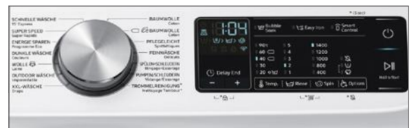
Dot LED Display